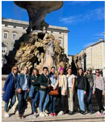
Ein Teil der jungen Frauenrunde beim Ausflug in die Salzburger Altstadt

bei den Vorgängerinnen – auch dazu. So gabs bereits eine Reise zum Halsbacher Advent und einen Ausflug in die Salzburger Altstadt, samt Stadtführung und gemütlicher Einkehr auf der Stadtalm. Wo bereits Pläne für den nächsten Einsatz der beiden Frauenrunden geschmiedet wurden: